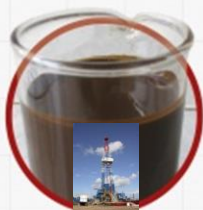
Западное и Бугровское месторождения. Частинский район