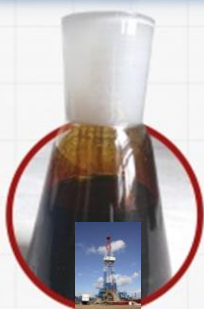
Осинское месторождение. Осинский район