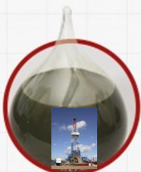
Мальцевское месторождение. Чердынский район