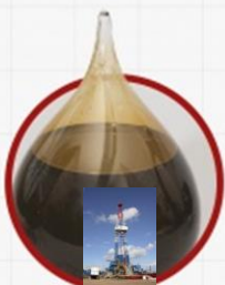
Шершнёвское месторождение. Усольский район