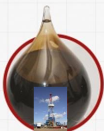
Викторинское месторождение. Октябрьский район