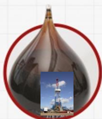
Трифоновское месторождение. Октябрьский