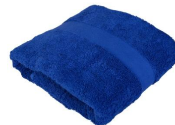
Полотенце личное 330,76 руб. +2,1%