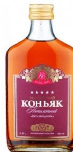
Коньяк (л) 1067,41 руб. +0,8%