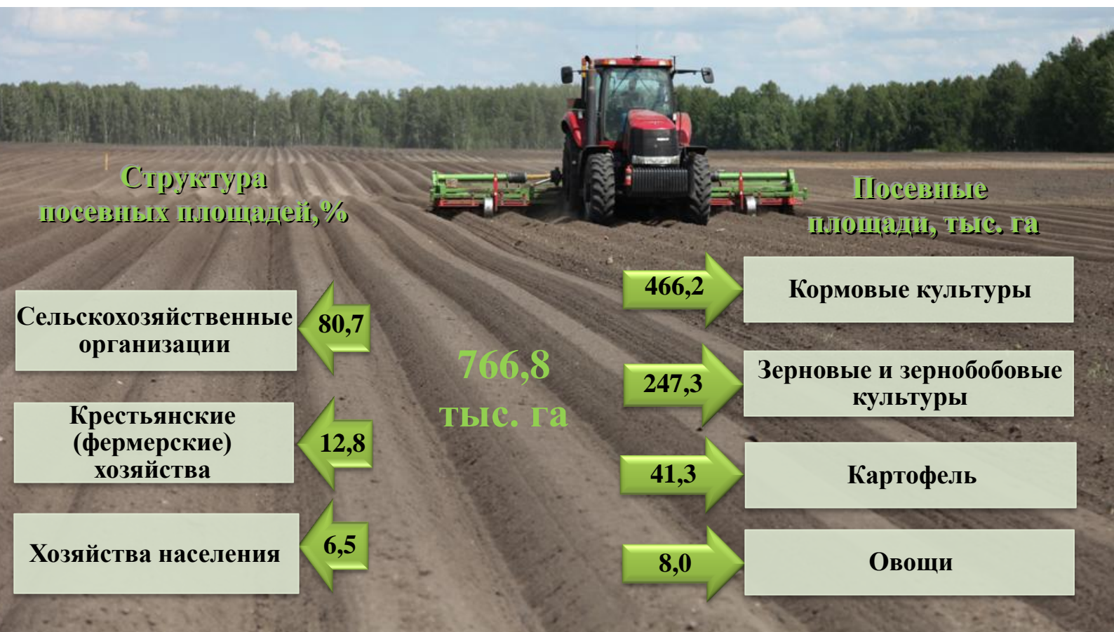
Динамика посевных площадей Пермского края, тыс. га

Основные показатели состояния растениеводства в сельскохозяйственных организациях Пермского края в 2016 году