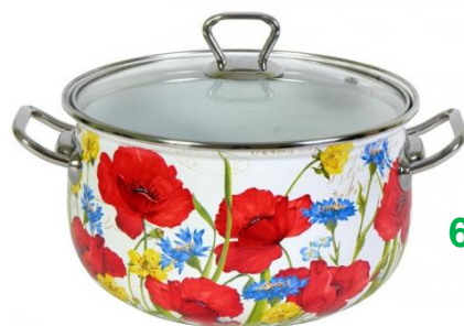
Кастрюля 662,38 руб. +1,9%