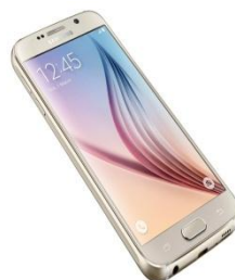
Смартфон 8338,33 руб. -1,9%