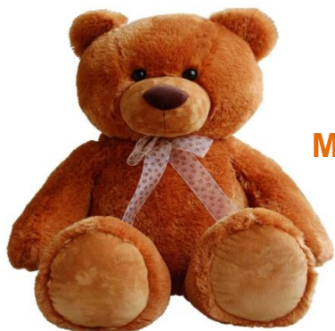
Мягкая игрушка 540,71 руб. +0,2%