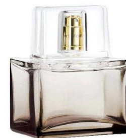
Туалетная вода (100 мл) 1630,47 руб. +4,2%