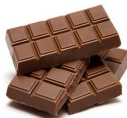
Шоколад (кг) 808,03 руб. -2,0%