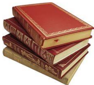
Книга 359,35 руб. +2,4%